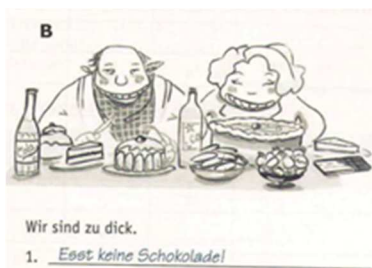
Abb. 8 NW A1 AB, S. 141