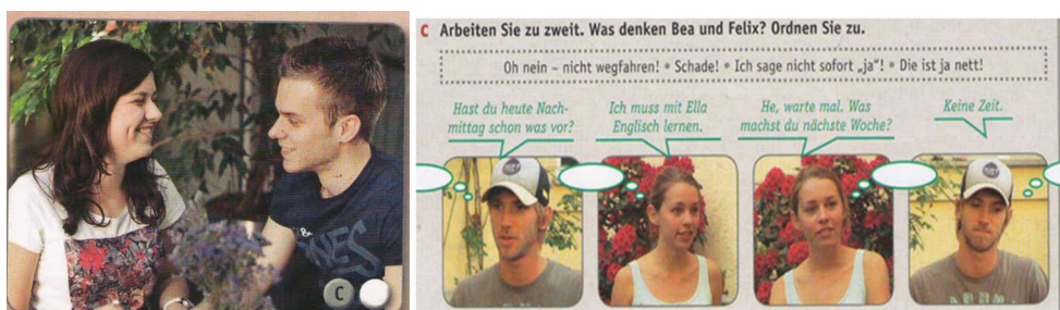
Ben & Carina, Abb. 10 NW A1 KB 2018, S. 52 Bea & Felix, Abb. 11 NW A1 KB 2018, S. 70

Im Zuge der Analyse konnten aber zahlreiche Beispiele gefunden werden, die dem heteronormativen Bild entsprechen. So trifft Ben in Kapitel 5 auf Carina (vgl. NW A1 KB 2018, 52) und im Film in Kapitel 6 knistert es zwischen Bea und Felix (vgl. NW A1 KB 2018, 70). In Kapitel 8 ziehen Carla und Alex zusammen in eine neue Wohnung (vgl. NW A1 KB 2018, 89) und die Paare, die eine Wohnung suchen, entsprechen auch dem heteronormativen Bild (vgl. NW A1 AB 2018, 100). In Kapitel 10 hat Jana ein Date mit einem Mann (vgl. NW A1 KB 2018, 110f), in Kapitel 11 gibt die Frau zu Hause im Wohnzimmer Aufforderungen an ihren kranken Mann (vgl. NW A1 KB 2018, 124).