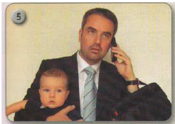
Abb. 1 NW A1 KB 2018, S. 73

das Kind kümmert, aufbricht und den Vater an ihre Stelle setzt.