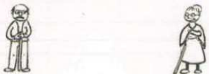
Abb. 3, NW A1 AB 2018, S. 60

Im Lehrwerk werden hauptsächlich junge Menschen bzw. Menschen mittleren Alters dargestellt, alte Menschen bilden die Ausnahme (vgl. NW A1 KB 2018, 127; NW A1 AB 2018, 70, 118 + 147). So findet man beispielsweise nicht einmal in Kapitel 5 (Tag für Tag), wenn es um Familienmitglieder geht, ein Foto der Großeltern. Großeltern werden lediglich im Familienstammbaum im Arbeitsbuch stereotypenhaft als alte Menschen mit Stock dargestellt: