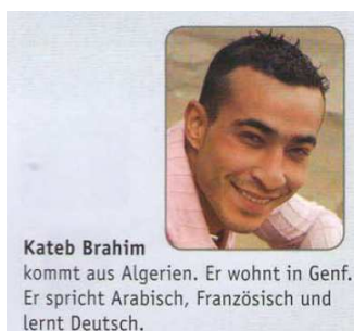
Abb. 4 NW KB A1 2018, S. 12

Auf den Fotos und in den Illustrationen werden überwiegend Menschen weißer Hautfarbe abgebildet, die zum Großteil aus den deutschsprachigen Ländern (dabei hauptsächlich aus Deutschland) bzw. aus Europa stammen. Die Ausnahme bilden Menschen asiatischer Herkunft, eine Person aus den USA und eine Person aus Algerien (vgl. NW KB A1 2018, S. 12). Auch unter den bekannten Persönlichkeiten aus D/A/CH werden ausschließlich Personen weißer Hautfarbe und ohne Migrationshintergrund angeführt (vgl. NW KB A1 2018, 41). Die lebensweltliche Realität, dass die deutschsprachigen Länder Migrationsgesellschaften sind und Menschen unterschiedlicher Herkunft dort (zum Teil seit Generationen) leben, wird nur marginal repräsentiert. Es gibt nur wenige Beispiele: