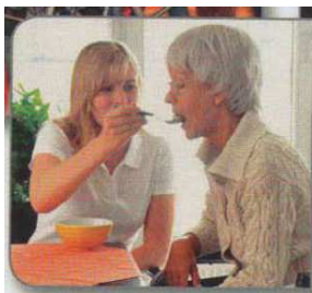
Abb. 7 NW A1 KB, S. 127

Es werden im Lehrwerk hauptsächlich gesunde, vitale, größtenteils schlanke Personen dargestellt und so gut wie keine Personen mit Behinderungen/Beeinträchtigungen gezeigt. Dies entspricht natürlich nicht der lebensweltlichen Realität – Menschen mit Behinderungen/ Beeinträchtigungen werden deshalb im Lehrwerk unsichtbar gemacht. Einzig in Kapitel 11 (Gesund und munter) wird eine alte Dame abgebildet, die auf die Hilfe einer Pflegerin angewiesen ist und möglicherweise im Rollstuhl sitzt (vgl. NW A1 KB 2018, 127). Im Arbeitsbuch werden im selben Kapitel Menschen illustriert, die zu dick sind und denen die Lernenden Tipps im Imperativ geben sollen (vgl. NW A1 AB 2018, 141).